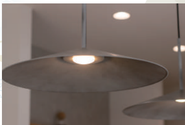
こだわりの照明プラン