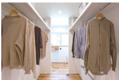
生活しやすい最高の洗濯動線