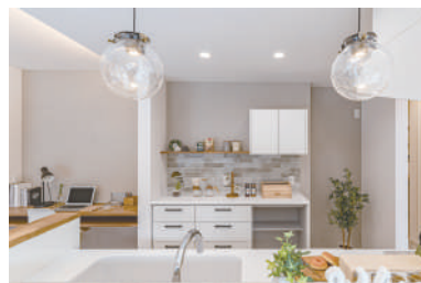
お気に入りのキッチンと洗面所